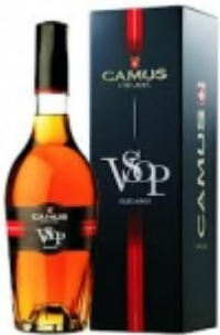
CAMUS V.S.O.P. 0,7 L 230.00 zÅ,

Koniak produkowany w najlepszym regionie na Åwiecie. Nadzwyczaj aromatyczna kompozycja ponad 60 destylatÅw pochodzÅcych z gÅwnych 4 regionÅw Cognac z przewagÅ destylatÅw z Borerie nadajÅcych koniakowi bardzo kwiecistego charakteru. W smaku doskonaÅ, a harm [SzczegÅy produktu...]