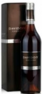
COGNAC DAVIDOFF 0,7 269.00 zÅ,

Koniak produkowany w najlepszym regionie na Åwiecie. Nadzwyczaj aromatyczna kompozycja ponad 60 destylatÅw pochodzÅcych z gÅwnych 4 regionÅw Cognac z przewagÅ destylatÅw z Borerie nadajÅcych koniakowi bardzo kwiecistego charakteru. W smaku doskonaÅ, a harm [SzczegÅy produktu...]